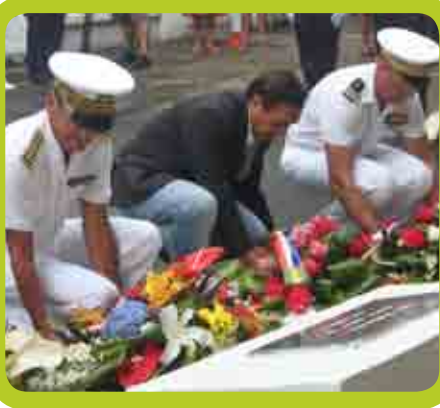
5 mai - La cérémonie à la mémoire des policiers morts pour la France et des policiers décédés en service.