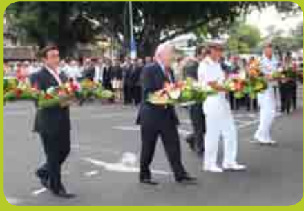
18 juin - Le 73 e anniversaire de l'Appel du 18 juin 1940 du Général de Gaulle, au pied de la Stèle de la France Libre.