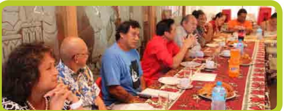
20 juin - Une délégation des résidents du lotissement Urumaru de Sainte Amélie.