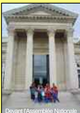
Devant l'Assemblée Nationale

l'institutrice et aux parents qui ont soutenu ce projet exceptionnel!