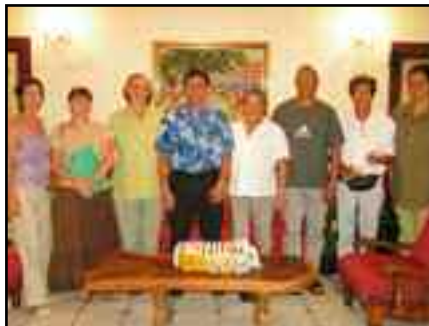
06-06 : le nouveau bureau de la ligue contre le cancer.