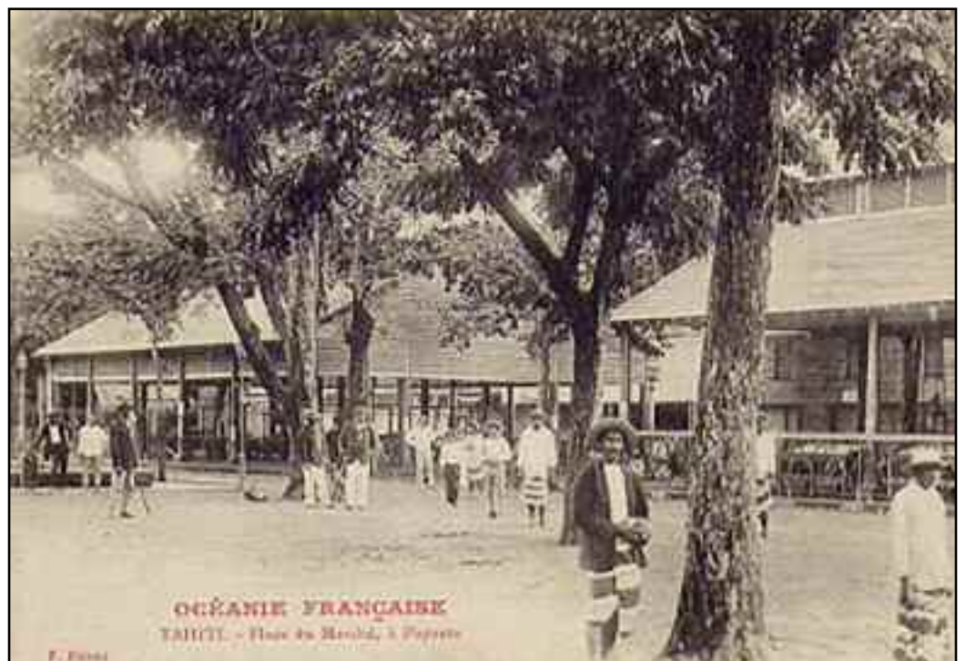
Le Marché de Papeete au début du XX ème siècle Source : www.janeresture.com (2006)