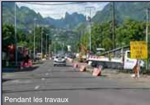
Pendant les travaux

La Ville de Papeete a lancé un vaste programme de lutte contre les inondations. Le quartier résidentiel de Taunoa - Fariipiti, a été identifié comme secteur prioritaire. En effet, à chaque pluie, cette zone se retrouve complètement inondée. Un important programme de réaménagement du Cours de l'Union Sacrée a alors été initié. Il comprend :