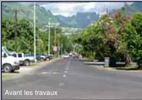
Avant les travaux