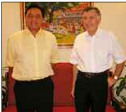
08-06 : Monsieur Serge PAQUY, contrôleur général de l'inspection générale de la Police Nationale en mission d'inspection en Polynésie française.