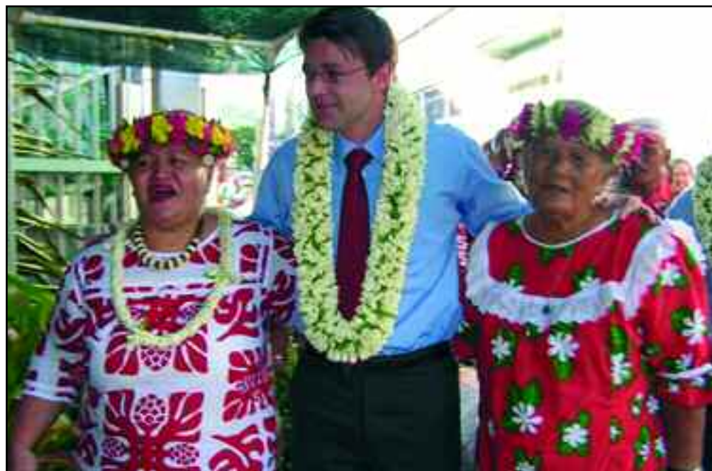
Visite du Ministre de l'Outre-Mer, Monsieur François BAROIN, à Papeete lors de son passage en Polynésie Française, le jeudi 30 mars 2006