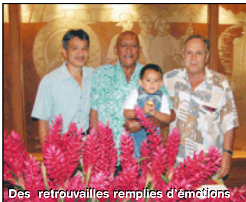
Des retrouvailles remplies d'émotions