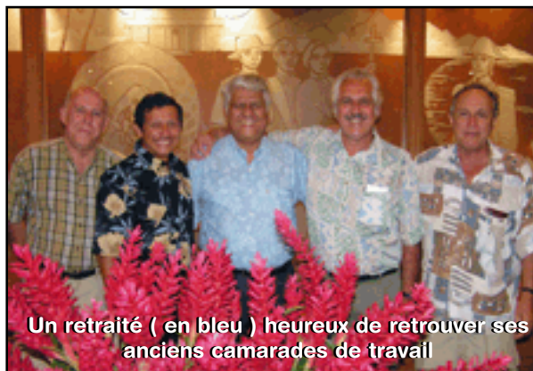
Un retraité ( en bleu ) heureux de retrouver ses anciens camarades de travail